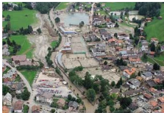
Fig. 2 Piena di Klosters (GR) nell'agosto 2005.