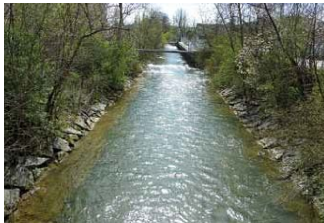
Fig. 1 Alveo canalizzato del fiume Wigger presso Zofingen (AG).

Negli alvei ristretti e canalizzati il deflusso aumenta rapidamente e provoca picchi di piena nel corso inferiore del fiume. Quando la sezione di deflusso è troppo piccola, l'acqua si crea un proprio percorso, con conseguenze fatali per la popolazione e le infrastrutture situate nelle zone densamente abitate (fig. 2). Dal 1987 la frequenza delle piene in Svizzera è in notevole aumento. L'entità dei danni mostra che gli alvei canalizzati, e quindi gli spazi progressivamente sottratti ai corsi d'acqua, costituiscono, in seguito alla crescente urbanizzazione, una minaccia per la sicurezza delle persone. La frequenza di eventi estremi ha costretto le autorità a riflettere