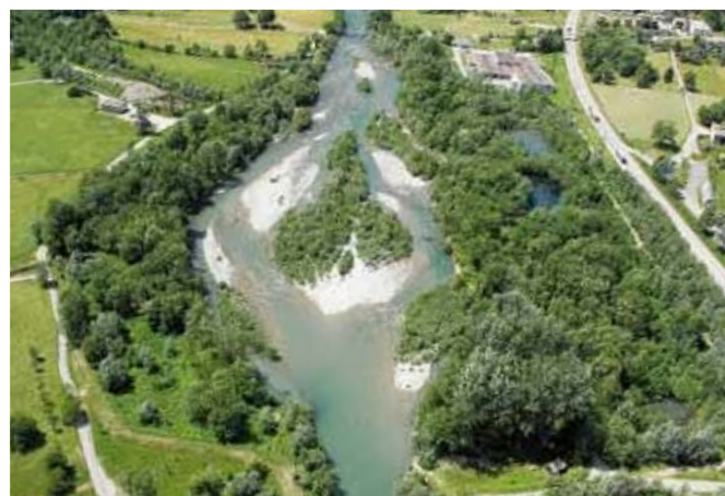
Fig. 3 Allargamento nella Val Mesolcina presso Grono (GR).