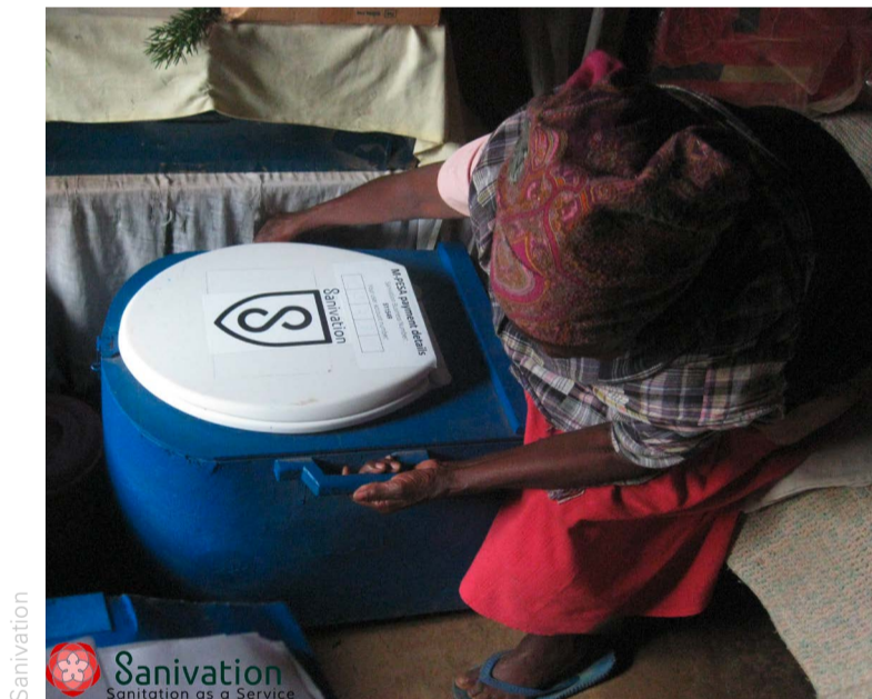
Abb. 2: Bei der Container-based Sanitation (CBS) werden Fäkalien und Urin in einem Container gesammelt. Der CBS-Anbieter sammelt die Container regelmässig ein und entsorgt deren Inhalt bzw. verwertet sie weiter.

«Weltweit gibt es derzeit sieben oder acht grössere CBS-Anbieter», erklärt Heiko Gebauer. «Sie bedienen jeweils zwischen 100 und 1 500 Haushalte. Um wachsen zu können und die Kosten möglichst gering zu halten, müssen sie die Prozesse automatisieren.» Nur mit digitalen Hilfsmitteln sei es möglich, dass solche Firmen irgendwann vielleicht 10 000 und mehr Haushalte erreichen könnten.