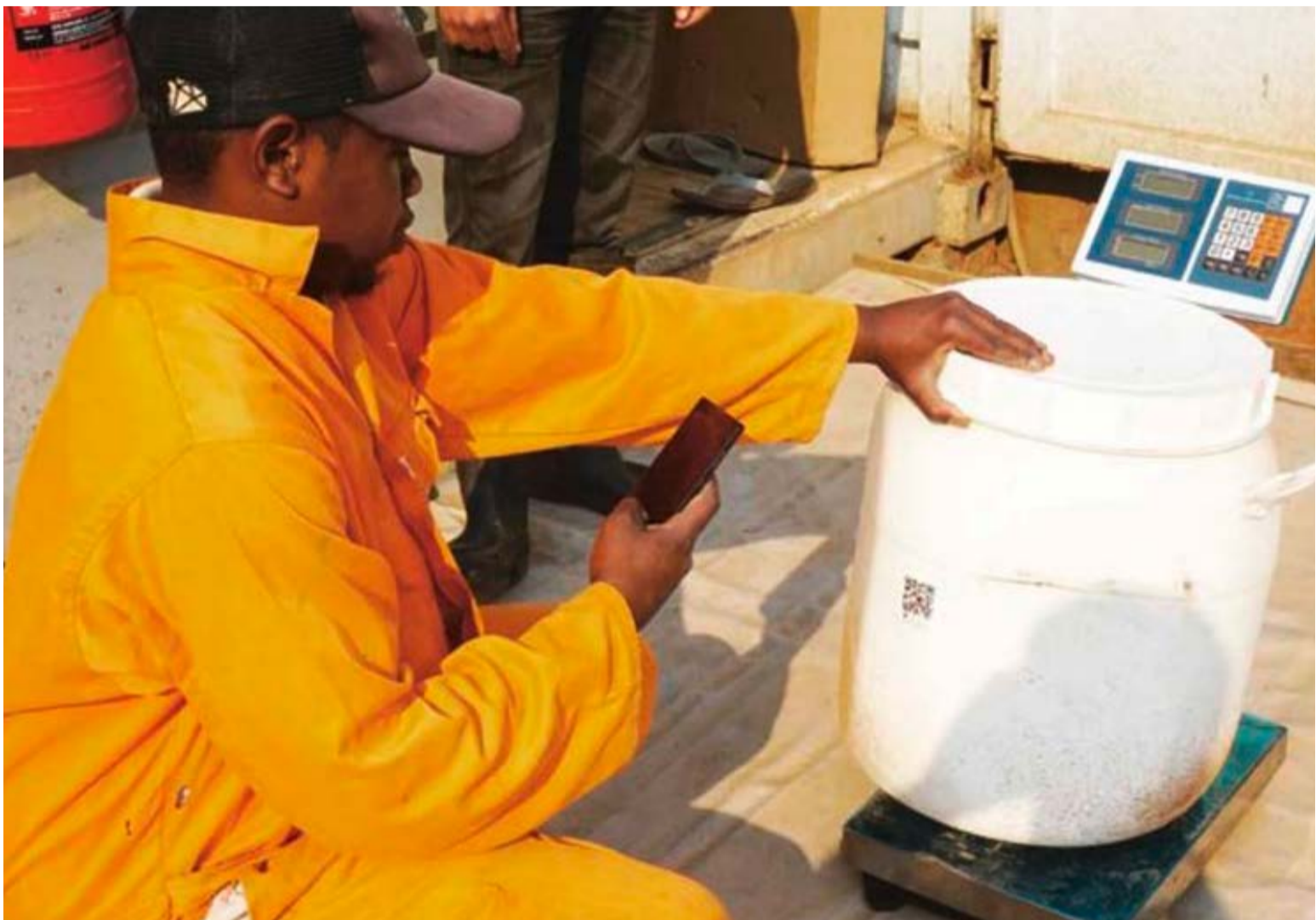
Abb. 1: Ein Mitarbeiter eines Toilettenanbieters scannt den QR-Code des eingesammelten Containers.

Bezahlen via Mobiltelefon, Ersatzteile aus dem 3D-Drucker, Fehlermeldung via NFC-Tag – die Eawag-Doktorandin Caroline Saul ist bei Firmen, die in Entwicklungsländern Container-Toiletten auf den Markt bringen, auf erstaunlich moderne Hilfsmittel gestossen. In der Verbreitung solcher Techniken sieht sie eine grosse Chance. Mirella Wepf