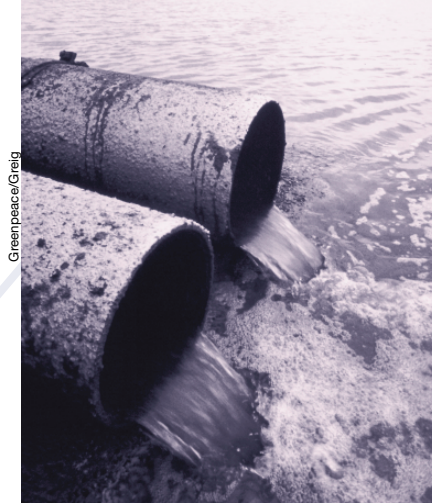
La stratégie OSPAR: éliminer les rejets de substances dangereuses d'ici 2020.

La stratégie OSPAR visant la cessation des rejets, émissions et pertes de substances dangereuses dans l'environnement marin a le but ambitieux d'éliminer les rejets d'ici 2020 [12]. Cet objectif demande de gros efforts de la part des parties contractantes de la Convention OSPAR mais aussi de celle des groupes sociaux, sociétés et associations impliquées. Il était donc primordial de mettre au point une méthode solide pour la sélection et la détermination des sub-