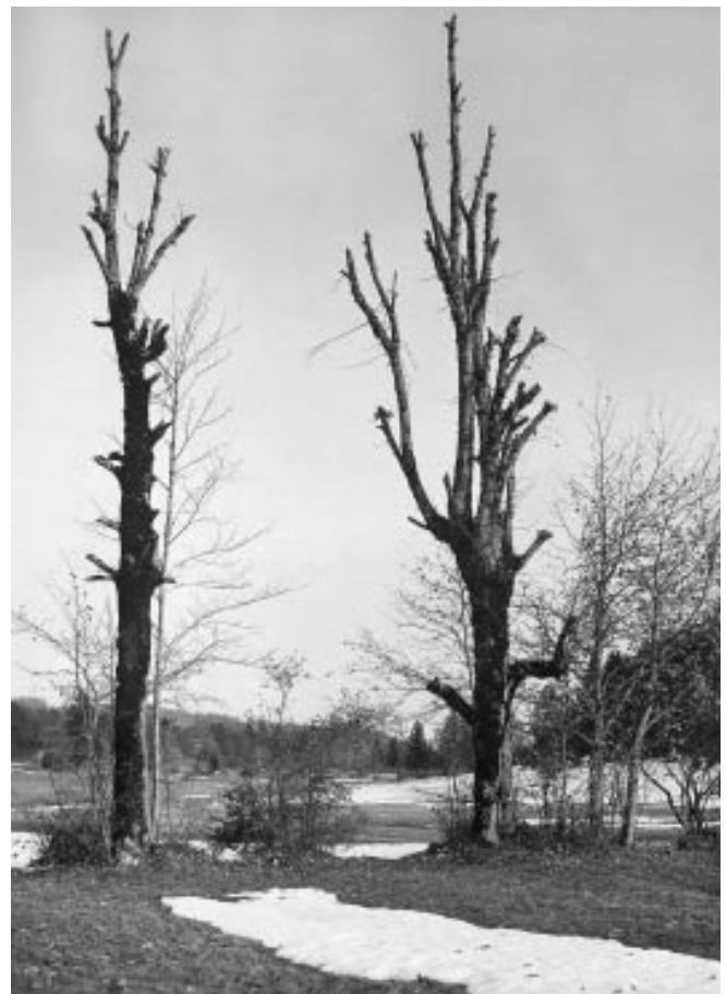
Abbildung 8: «Stark geschneitete Linde auf einer Privatweide» 1921 (Romont).

Was sich schon im 19. Jahrhundert abgezeichnet hat, gilt für das 20. Jahrhundert erst recht: Die Laubfütterung fand kaum innerhalb des Waldes statt (Abbildung 9). Im Tessin zog man die Schneitelbäume «in der Nähe der Gebäulichkeiten, längs Wegen und Wasserläufen und längs der Peripherie seines Eigentums, auf geringwertigen und versumpften Wiesen.» 169 In Uri standen die Schneitelbäume «gewöhnlich ein-