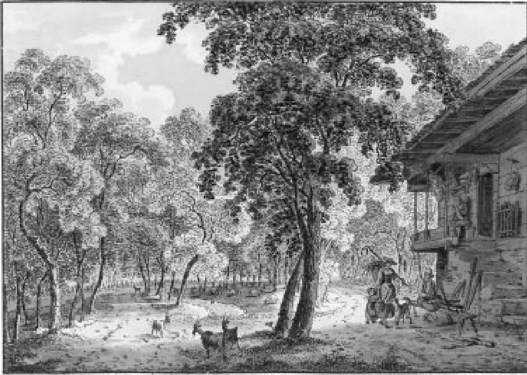
Abbildung 3: Ziegenweide in lichtem Wald 1808 (bei Bönigen, Franz Niklaus König, Umrissradierung koloriert, aus dem Album «Souvenirs des Environs d'Unterseen et d'Interlaken», Schweizerische Landesbibliothek Bern, Sammlung R. und A. Gugelmann).

populärwissenschaftlichen Buch «Schöner Wald in treuer Hand» zugunsten der Wytweiden sogar landschaftsästhetische Argumente. «Wir möchten die bestockten Weiden auch im Landschaftsbild nicht missen, denn sie geben diesem mit ihren tief beasteten Wettertannen oder dem lichten Grün ihrer Lärchen, mit dem Geläute weidender Herden und dem Spiel von Licht und Schatten, einen ganz besonderen Reiz.» 68 In dieser positiven Bewertung ist der Keim angelegt, dass sich diese Form von Waldweide bis heute gehalten hat.