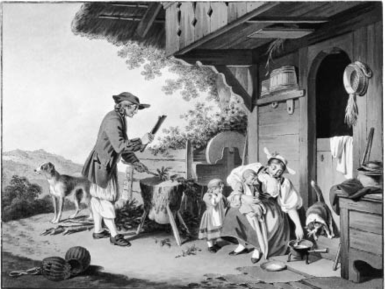
Abbildung 6: Zerkleinern von Nadelreisig, wohl zur Zubereitung von Viehfutter 1791 («Les Soins maternels», Sigmund Freudenberg, kolorierte Umrissradierung, Landesbibliothek Bern, Sammlung R. und A. Gugelmann).