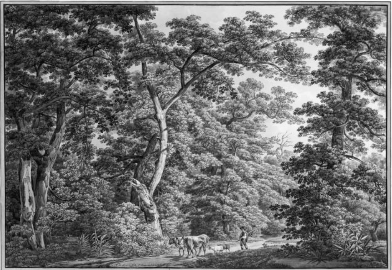
Abbildung 2: Kühe und Schafe im Wald 1812 (in der Hard bei Basel, Peter Birmann, Bleistift, Feder, Öffentliche Kunstsammlung Basel, Kupferstichkabinett).