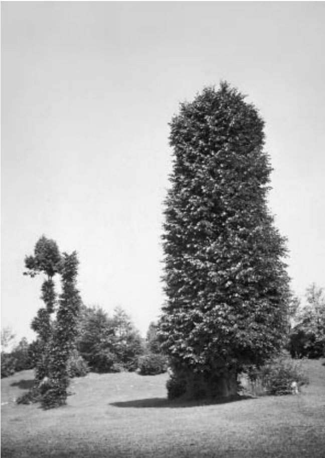
Abbildung 7: «Geschneitete grossblättrige Linde» 1919 (Romont).