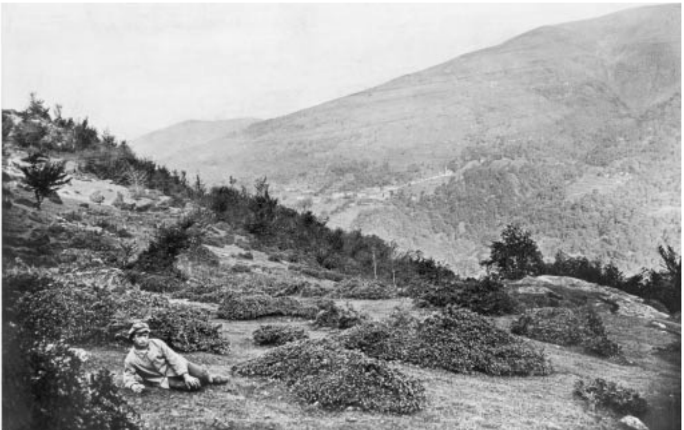
Abbildung 4: «Geissen- oder Weidbuchli»: von Ziege und Grossvieh jahrelang abgefressene Buchen 1914 (Sonvico, Kanton Tessin).