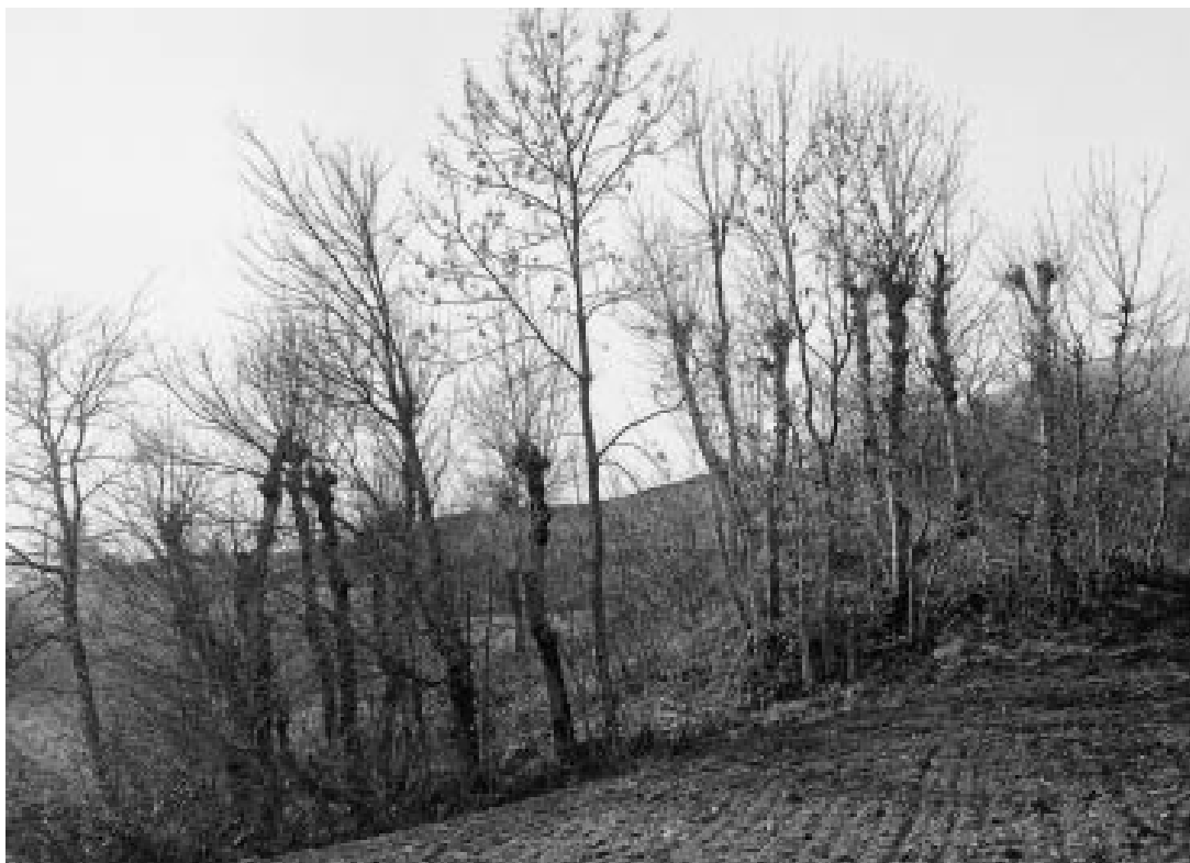
Abbildung 9: «Lesesteinhaufen mit geschneitelten Eschen» 1920 (Villars-Burquin, H. Grossmann, Bildarchiv WSL).