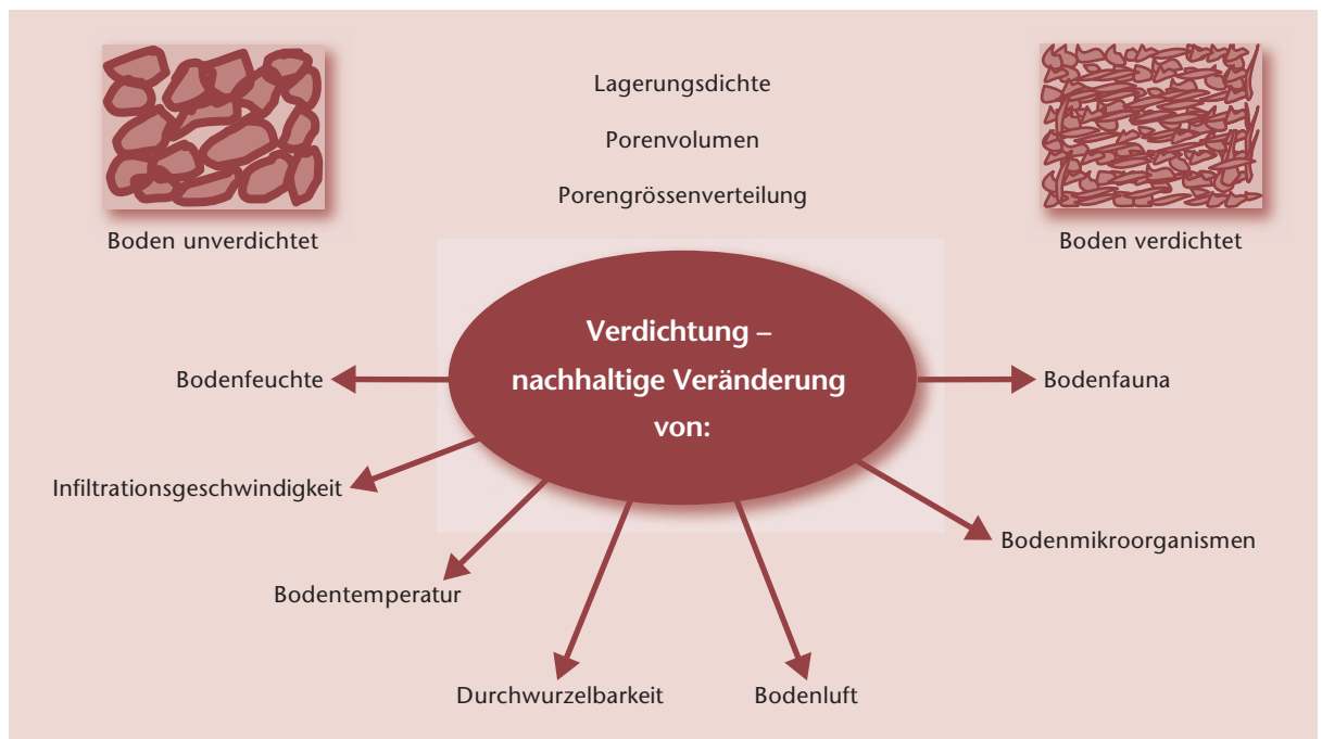
Abb 1 Wirkung nachhaltiger Bodenverdichtungen in Waldböden. Kenngrößen des Bodenlufthaushaltes und biologische Parameter (Durchwurzelbarkeit, mikrobiologische Parameter) sind ebenso wichtig für die Charakterisierung von Bodenstrukturstörungen wie bodenphysikalische Parameter (Lagerungsdichte, Porenvolumen).

mit die bodenschonende Holzernte, ein wichtiger Aspekt der Waldbewirtschaftung. Das Befahren mit Forstmaschinen führt auf einem Grossteil der Schweizer Waldböden im Bereich der Fahrspuren zu tiefgreifenden und lang anhaltenden Bodenveränderungen. Die Transportleistung des Bodens für Wasser und Luft wird eingeschränkt, womit wichtige Bodenfunktionen beeinträchtigt werden (Frey et al 2009, Kremer et al 2009). Der Schutz unserer Waldböden ist wichtig, weil bereits entstandene Beeinträchtigungen nur mit grossem Aufwand zu beheben sind.