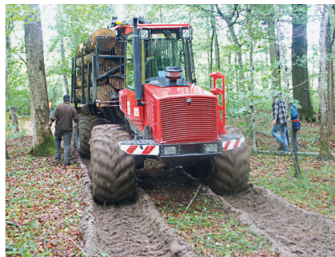
Abb 2 Fahrversuche in Ermatingen (Kanton Thurgau): Durch das gezielte Anlegen von Fahrspuren in einem kontinuierlich ansteigenden Bodenfeuchtegradienten konnte eine stetig zunehmende Deformation der Bodenstruktur erzeugt werden.

Intensive Wechselwirkungen zwischen biologischen, chemischen und physikalischen Prozessen nach physikalischen Bodenbeeinträchtigungen finden im Boden unter anderem über den Gashaushalt statt. Intakter Boden besteht je zur Hälfte aus fester Substanz und aus luft- oder wasserführenden Poren. Ein beschädigtes und eingeschränktes Porensystem verringert die Transportleistung für Wasser und Luft. Die Feinporen sind häufiger mit Wasser gefüllt. Weil Sauerstoff zehntausendmal langsamer in Wasser als in Luft diffundiert, wird Sauerstoff im Porenraum viel langsamer nachgeliefert. Der Gasaustausch zwischen Boden und Atmosphäre ist in einem verdichteten Boden, beispielsweise in Fahrspuren, gestört. Dadurch werden bei gegebenen Klima- und Feuchtigkeitsbedingungen der Luft- und Wasserhaushalt im Boden und damit die Lebensbedingungen der Mikroorganismen in Bezug auf O 2 - beziehungsweise