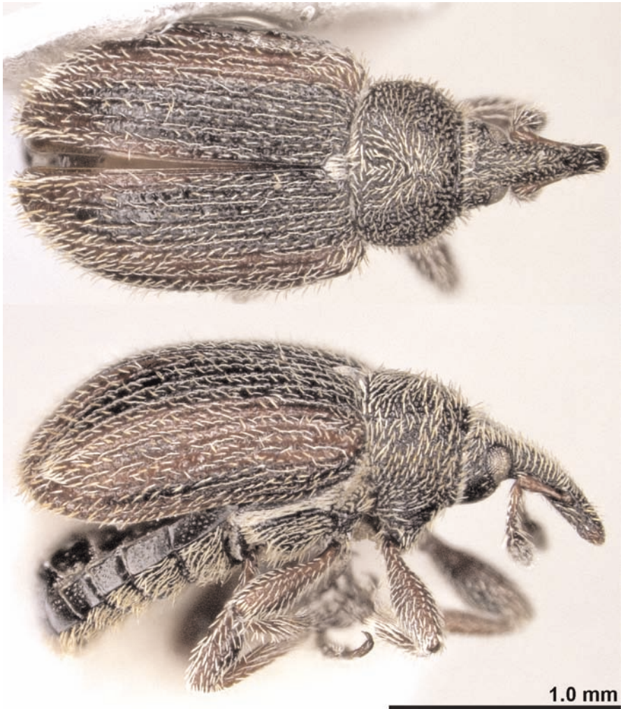
Fig. 1. Habitus (dorsal, lateral) of the adventive Gymnetron rotundicolle Gyllenhal, 1838, canton Ticino, Porza. The photos were taken using the VHX-2000 photograph system version 2.2.3.2. (Keyence Corporation) at the NMBE.

Lombardia: Monguzzo (Como), 31.3.2012, leg. & coll. L. Diotti; 3 males, 2 females, Lago di Alserio (Como), 2.6.2012, leg. & coll. L. Diotti; 2 males, 3 females, Emilia Romagna, Varano (Parma), 12.11.2010, leg. & coll. L. Diotti; 1 male, Umbria: Monte Martano, Giano dell'Umbria (Perugia), 700–900 m a.s.l., 25.5.2012, leg. & coll. A. Paladini.