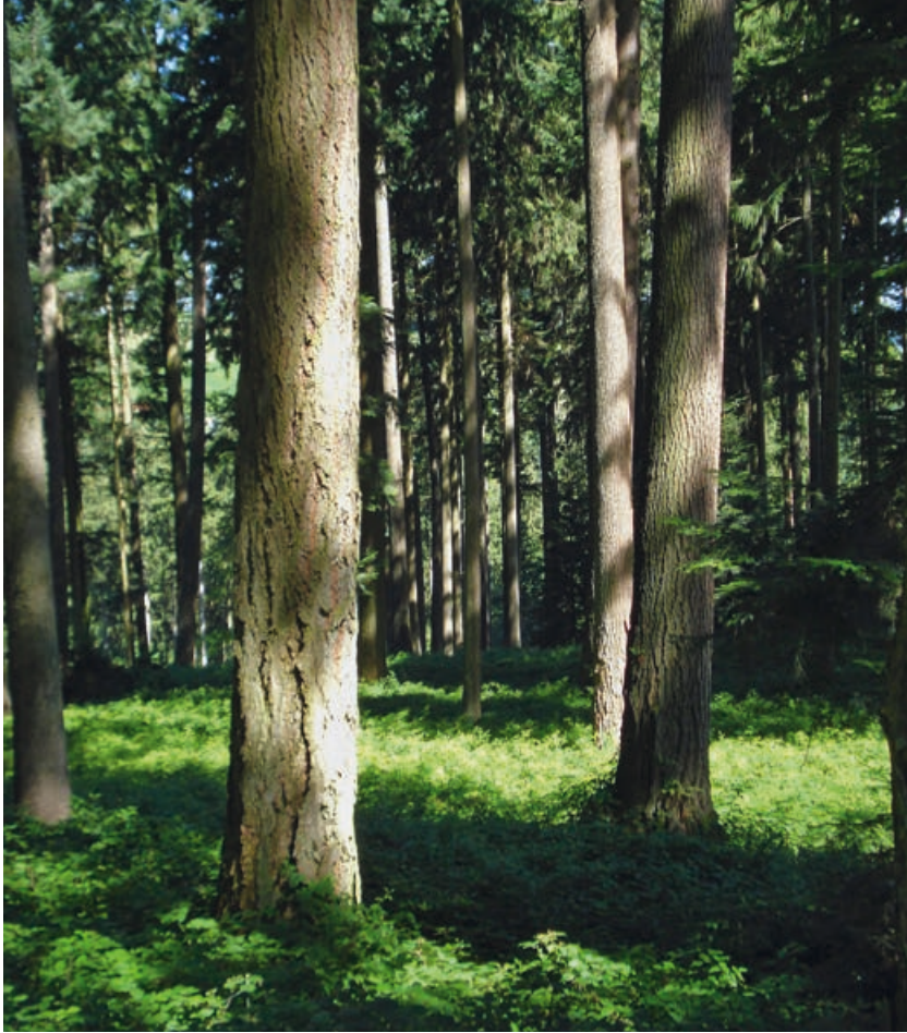
Abb 3 Nadelbaum-Hochwald mit Douglasie bei Willisau (LU).

gung in der Schweiz, dass Forstleute die Entwicklung zu vermehrtem Douglasienanbau positiv bewerten, während Personen aus dem Naturschutz diese eher negativ einschätzen und einen begrenzten Anbau, ausschliesslich in Mischbeständen fordern.