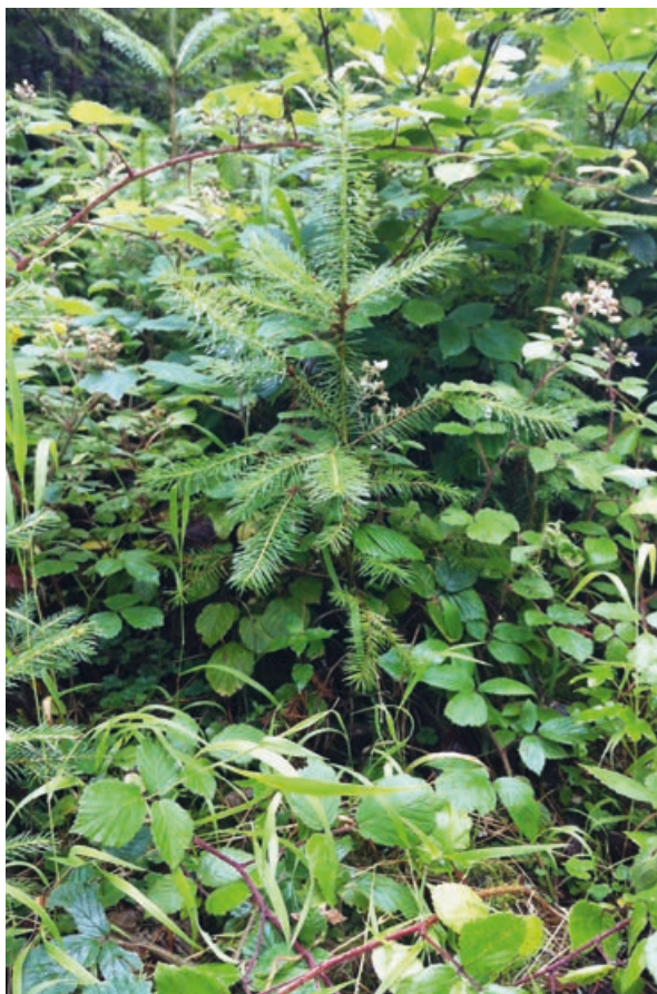
Abb 2 Natürliche Verjüngung der Douglasie bei Dintikon (AG).