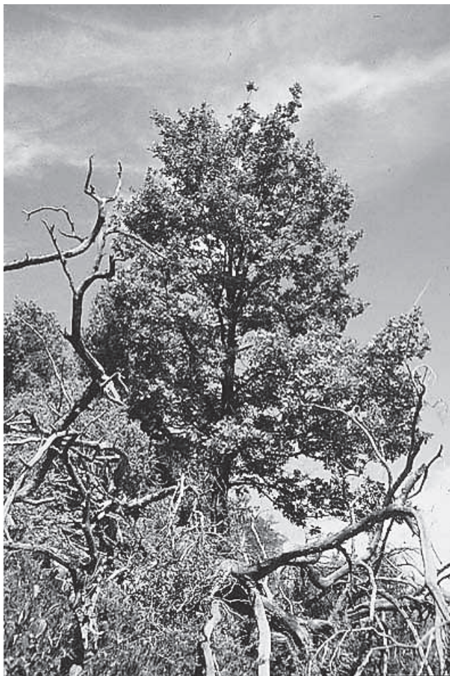
Abb. 1. Eine grosse, vitale Flaumeiche vor einer toten, liegenden Föhre

möglich war, wurde die Deckung der Arten mittels siebenstufiger Schätzskala von Braun-Blanquet (1964) erhoben. Anschliessend erfolgte die Umrechnung der Braun-Blanquet-Skala in Deckungsprozent ( \ll R \gg = 0.1\% ; \ll + \gg = 0.5\% ; \ll 1 \gg = 3\% ; \ll 2 \gg = 15\% ; \ll 3 \gg = 37.5\% ; \ll 4 \gg = 62.5\% ; \ll 5 \gg = 87.5\% ). Es ist zu betonen, dass die Aufnahmen keinem statistischen Probedesign folgen. Es können damit auch nur bedingt räumliche Aussagen gemacht werden.