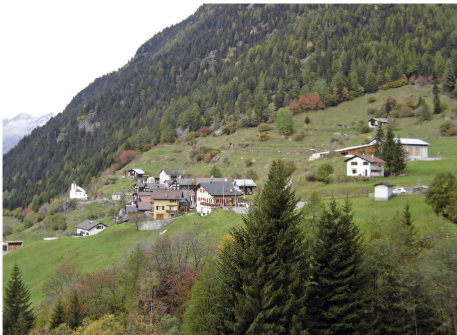
Abb. 1: Altanca, Valle Leventina (TI).

lungssystems wahrscheinlich, womit die Zielformulierung für die dezentrale Besiedlung und deren Umsetzung weitestgehend den Kantonen überlassen würde.