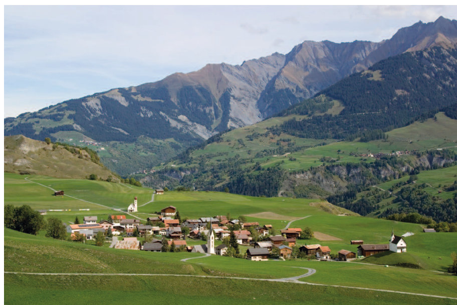
Abb. 2: Degen im Tal Lumnezia (GR) (Foto: Roland Zumbühl).

Vor diesem Hintergrund liegt es an den betroffenen Kantonen sich zu überlegen, welche dezentralen Siedlungs- und Wirtschaftsstrukturen langfristig erstrebenswert sind. Unter dem Stichwort «Poten-