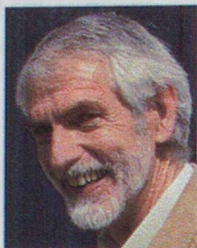
Par Jean Combe*

Les thèmes traités lors des précédentes journées figurent sous < http://www.unece.org/trade/timber/ffl/ >. Le programme de la Journée du 11 juin 2007 ainsi que le bulletin d'inscription peuvent y être téléchargés.