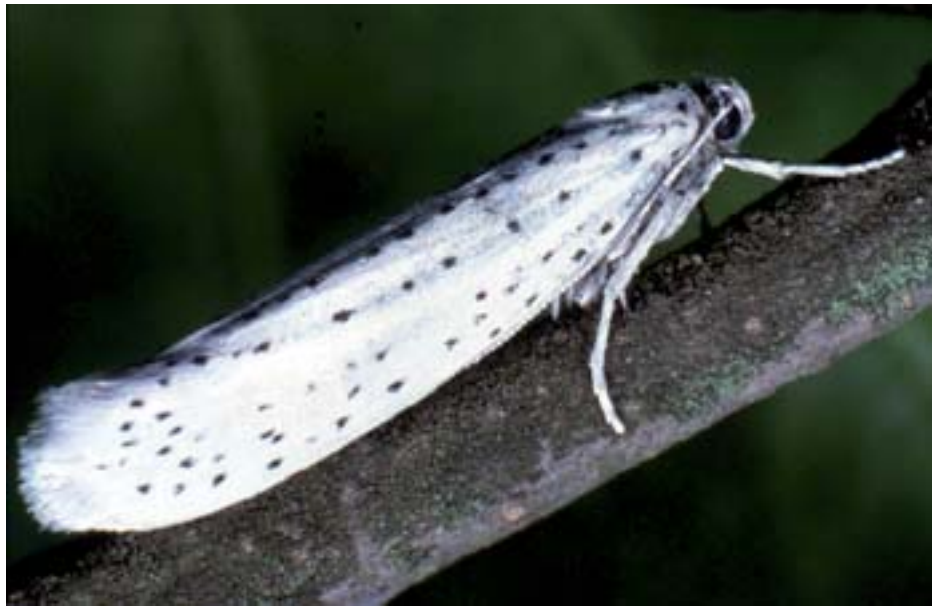
Fig. 2. Le farfalle hanno un'apertura alare di 15–25 mm e volano dal crepuscolo fino all'alba (farfalla notturna).

Le larve di questi microlepidotteri vivono in modo gregario all'interno di tele sericee bianche che avvolgono interamente le piante colpite, dando al paesaggio un aspetto invernale (fotografia di copertina). Questi attacchi spettacolari suscitano numerose richieste d'informazione da parte di persone sia interessate che preoccupate da tale fenomeno.