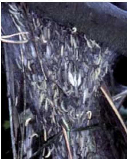
Fig. 9. Le trame sericee permettono il gregarismo con una concentrazione di larve superiore alle 1000 unità. A questo stadio si trovano le prime crisalidi.