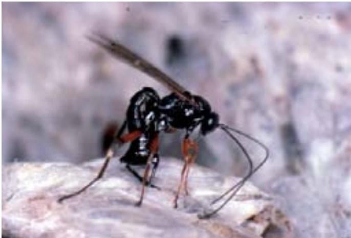
Fig. 15. Il controparassita icneumonide Itopectis maculator depone le sue uova all'interno delle crisalidi grazie ad un lungo ovodepositore in grado di penetrare nei bozzoli.