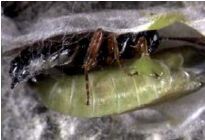
Fig. 13. Herpestomus brunnicornis è un controparassita icneumonide altamente specializzato che colpisce sia le larve che le crisalidi. Il suo ovodepositore è infatti molto corto; per deporre le uova nel corpo della larva questa vespa deve penetrare all'interno del bozzolo.