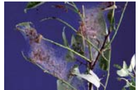
Fig. 8. Quando le larve raggiungono i 5 mm di lunghezza si spostano sulla cima dei rami e costruiscono un primo grande nido che viene costantemente ingrandito coinvolgendo foglie e rami nuovi. Le foglie vengono mangiate (defogliazione).