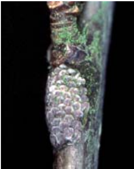
Fig. 3. Generalmente la femmina depone un'ovoplacca composta da circa 50 uova. La deposizione avviene sulla corteccia liscia di giovani rami, in prossimità delle gemme.