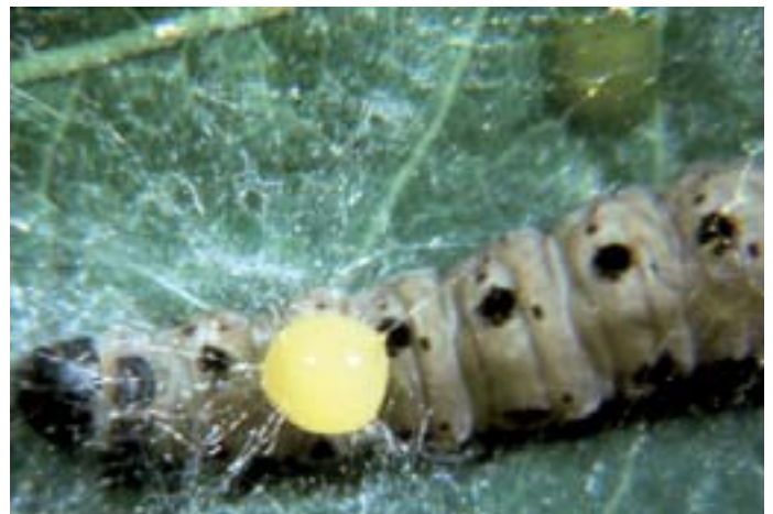
Fig. 18. La larva di Yponomeuta è stata colpita dal virus della poliedrosi. Quando la malattia è in una fase avanzata la pelle della larva si spacca facilmente lasciando fuoriuscire delle gocce di liquido contenenti il virus. La larva è ancora mobile e spostandosi diffonde la malattia sia nel nido sericeo che sulle foglie e sui rami, contribuendo così ad una rapida diffusione della malattia.