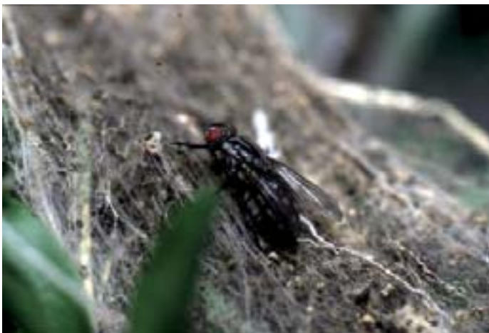
Fig. 17. Una larva della mosca predatrice Agria mamillata divora da 5 a 8 crisalidi di tignola nell'arco del suo sviluppo.