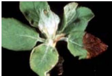
Fig. 7. Le foglie colpite assumono dapprima una colorazione rossa a partire dalla punta, diventano in seguito marroni e poi cadono.