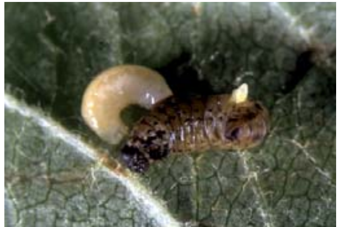
Fig. 14. Da un bruco morto di Yponomeuta fuoriesce una larva di Diadegma armillatum . Le tignole vengono colpite da questo controparassita sia allo stadio di larva che di precrisalide.