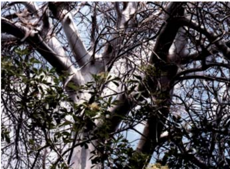
Fig. 12. Ciliegio a grappoli o Pado ( Prunus padus ) defogliato e ricoperto di nidi sericei. Le tele sono molto resistenti e compatte e se strappate dalla pianta formano delle lunghe strisce. Il Sambuco in primo piano non è stato colpito.

Le figure da 1 a 11 illustrano lo sviluppo e la biologia del genere Yponomeuta . La durata dei singoli stadi di sviluppo viene influenzata dalle condizioni meteorologiche.