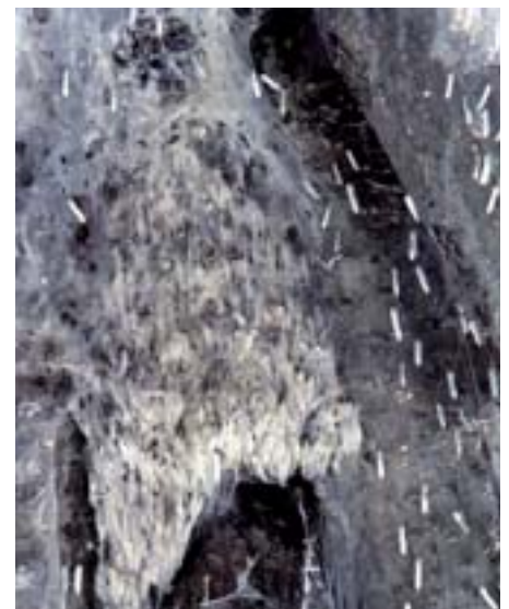
Fig. 11. L'incrisalidamento avviene direttamente all'interno del nido. Può capitare che alcune larve non si incrisalidino e vivano ancora per settimane consolidando e migliorando il nido.