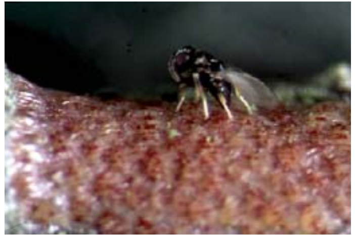
Fig. 16. Una vespa di Ageniaspis fuscicollis mentre depone le sue uova in una ovoplacca di Yponomeuta .