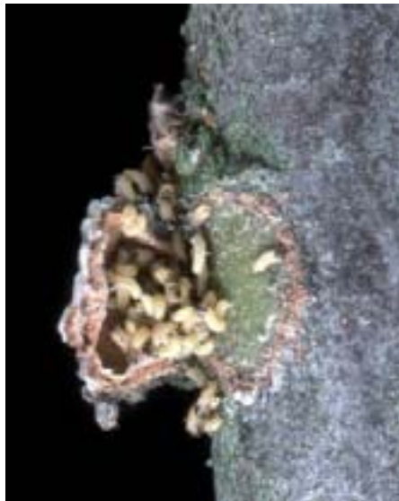
Fig. 4. Le larve schiudono dopo 3-4 settimane e svernano sotto il guscio dell'ovoplacca (aperto nella fotografia).