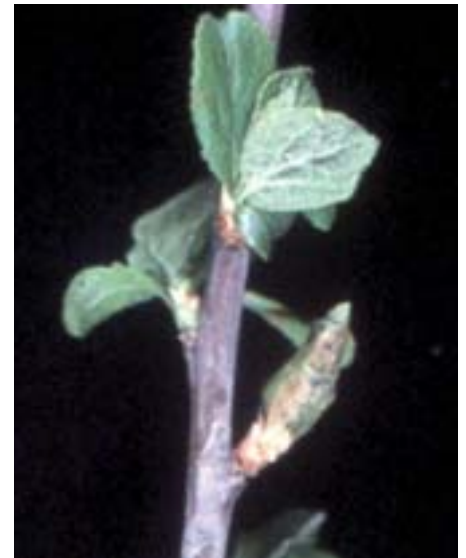
Fig. 5. Durante i primi stadi di sviluppo le larve mangiano dapprima l'interno delle gemme. Le gemme attaccate rimangono accartocciate e chiuse al momento della fogliazione.