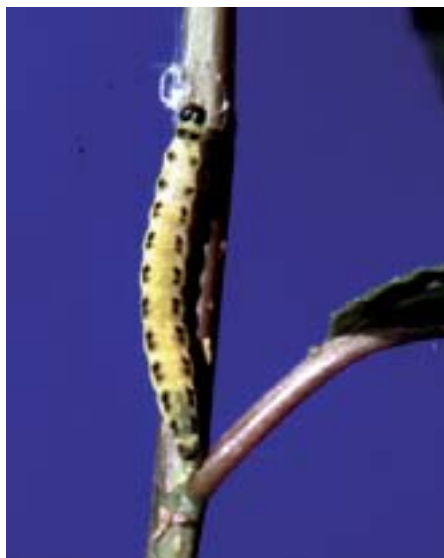
Fig. 10. Larva al 5° ed ultimo stadio di sviluppo (lunghezza ca. 20 mm).