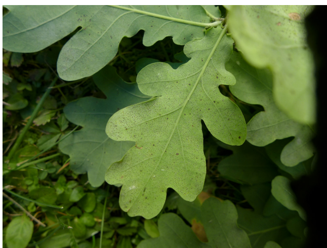
Erysiphe hypophylla

Grille de 5 x 5 km: Erysiphe hypophylla (Nevod.) U. Braun & Cunningt. Liste de synonymes: Microsphaera hypophylla Nevod., Microsphaera hypophylla Nevod. Verzweigthaariger Eichen-Mehltau (Art-ID: 25792)