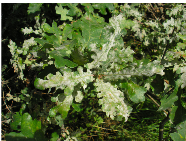
Erysiphe alphitoides

L'oidium du chêne fait partie des maladies du chêne les plus fréquentes en Europe. Il est dû à trois espèces de champignon très similaires, introduites indépendamment les unes des autres en Europe depuis l'Asie. Même si les symptômes foliaires déclenchés par l'oidium du chêne ont souvent un aspect inquiétant, c'est seulement combinée à d'autres facteurs que la maladie représente généralement une menace pour les chênes.